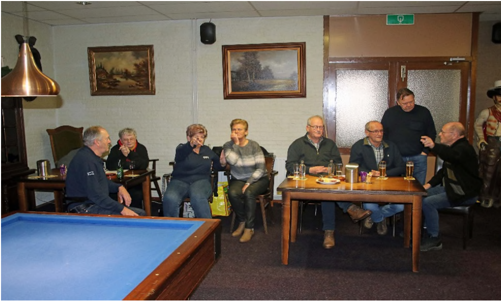
De deelnemers aan deze finaledag: